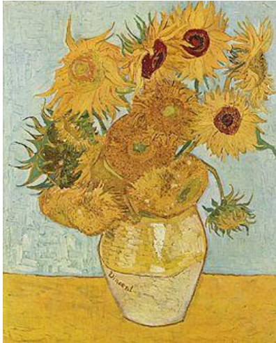
Een echte van Vincent Gogh