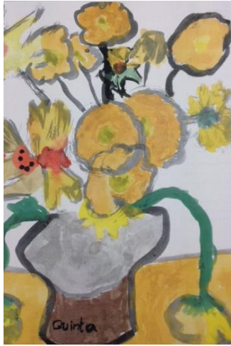
Een echte Quinta Meijer