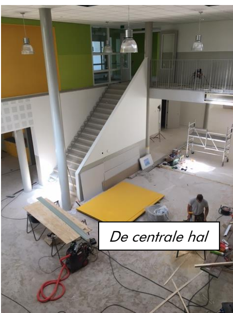
De centrale hal

- 4 Als laatste project wordt er gewerkt aan de inrichting van de school zelf. Welke meubels gaan er mee en welke zullen nieuw aangeschaft worden. Hierbij is naast functionaliteit en praktisch gemak ook aandacht voor comfort.